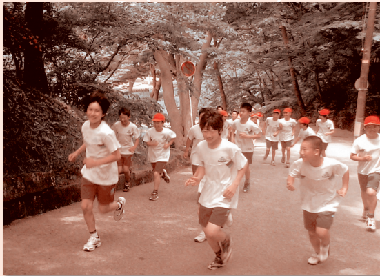
中通小学校 6月14日(月) 「三校合同千秋公園マラソン大会」