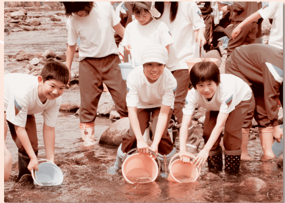
上新城小学校 6月8日(火) 「ヤマメ稚魚放流」