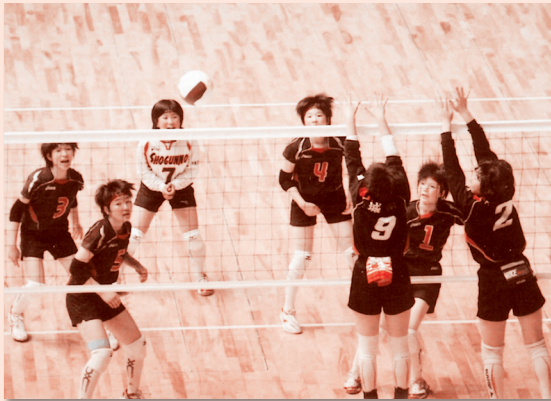
将軍野中学校 6月21日(月)

将軍野中学校バレーボール部は、県立体育館で行われた秋田市中総体決勝で初優勝を飾りました。来たる7月17・18・19日に行われる全県大会に出場します。