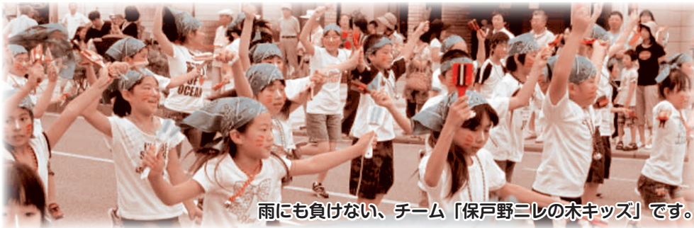
雨にも負けない、チーム「保戸野ニレの木キッズ」です。