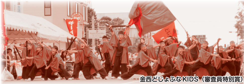
金西どじよふなKIDS (審査員特別賞)