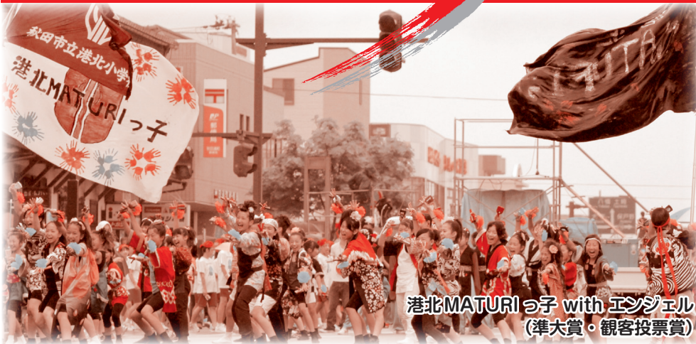
港北MATURIっ子 with エンジェル (準大賞・観客投票賞)

秋田の夏の定番「ヤートセ秋田祭」 市民参加者が多く集うこの祭り。 今年も各地区の「あきたっ子」たちが大いにもりあげてくれました。