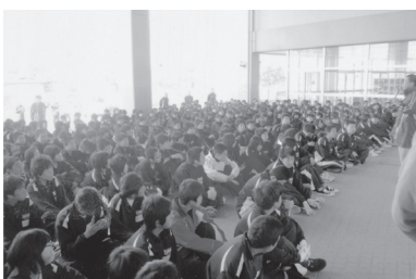
PTA校内環境美化活動