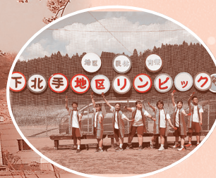
地区リンピック (地区民体育祭)

私たちの母校が閉校となることに対してはとても寂しく思いますが、それと同時に、下北手中学校で過ごせたことを誇りに思います。 閉校記念式典では卒業生の皆さんや地域の方々に、下中の歴史を「永遠（とわ）に繋ぐ」ことを誓いました。これまで育ててくれた下北手中と、地域の皆さんへの感謝を忘れずに、誇りをもって歩んでいきたいです。 今までありがとうございました。