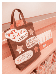
「かぞくぶっくぱっく」

ご家庭でも、読書の時間を設ける、同じ本を読んで話をするなど、家族みんなで読書の楽しさを共有してみてはいかがでしょうか。