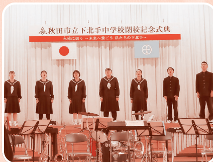
閉校記念式典 (校歌斉唱)