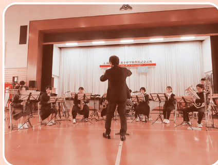
閉校記念式典 (吹奏楽部員、OB・OGによる記念演奏)

我が母校の閉校を迎えるにあたり、娘が最後の卒業生となることは感慨深いものがあります。閉校記念式典を立派にやり遂げた最後の卒業生たちに感謝の意を表します。 歴史ある下北手の幕引きとなりますが、いつかまた、この幕が上がることを夢見て進んでいきたいと思えます。 ありがとうございました。